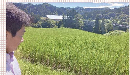
渇水時には域内をまわり現場を確認し、お話を聞き、関係課にて報告と協議