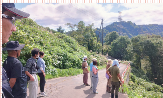
中部地区の行事や総会に参加