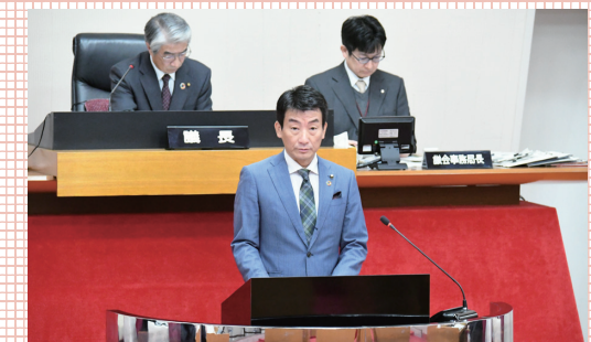
松代病院存続、高齢者支援、鳥獣被害、除雪改善、災害対応などを質す