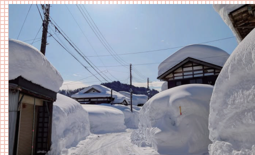
大雪時は特に高齢者にお話を聞き、関係課にて報告と協議