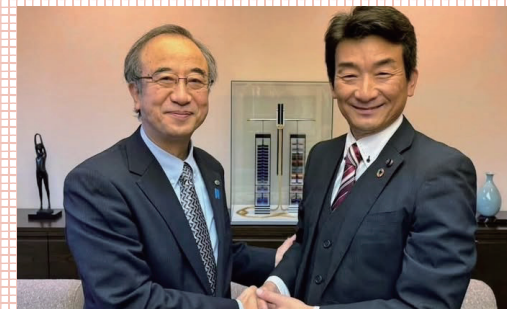
花角知事と懇談を重ね松代病院や松代高校の存続、ほくほく線ミニ新幹線化などを要望