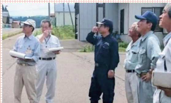
松之山地域の要望現場を県議と視察、協議