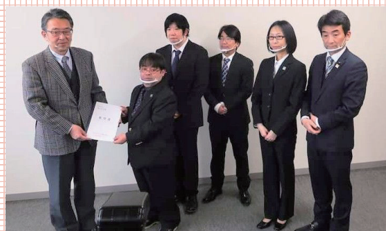
ろう者さんとも連携。応援を続けます