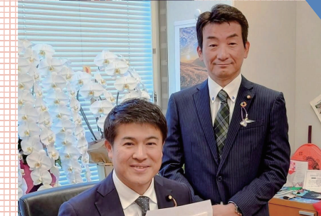
小林参院議員とも地域課題の相談を常に重ねる