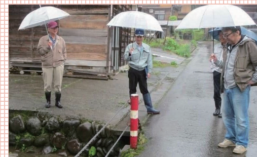
松代区内の改修要望。現場視察を重ね関係課にて報告と協議