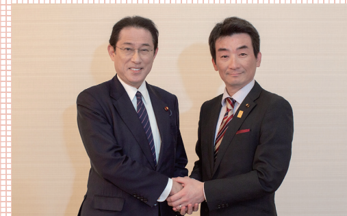
岸田前総理と面会。地域課題などを要望【毎年、仲間議員と共に国会陳情を実施】